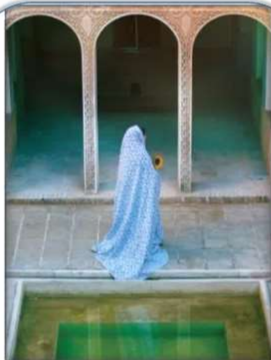
شهر ماکرم، مهمان ماکرم